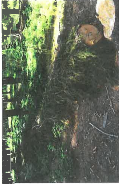
Lapák zakrytý větvením

Lapák je pokácený a odvětvový strom, podložený (aby brouci mohli využít celou plochu kmene) a zpravidla zakrytý větvením (zpmalení vysychání kůry). Káci se před předpokládaným začátkem rojení, tj. zpravidla do konce března. Lapáky se musí kontrolovat, a to především z důvodu jejich obsazení, aby bylo možné včas přikácet další lapáky. Ty se přikacují, je-li lapák plně obsazen (cca 1 závrt na 1 dm 2 v nejhustější napadené části kmene). Současně se kontroluje vývoj lýkožrouců, aby bylo možné lapáky včas asanovat.