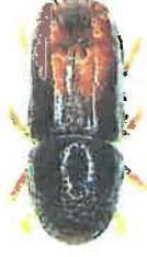
Dospělec lýkožrouta lesklého

se vyvíjí pod kůrou větvi stromů, ve vrcholové části koruny nebo na mladých stromcích; na kmeni dospělých smrků ve střední a spodní části se vyskytuje méně často. Vývoj trvá 6 – 10 týdnů.