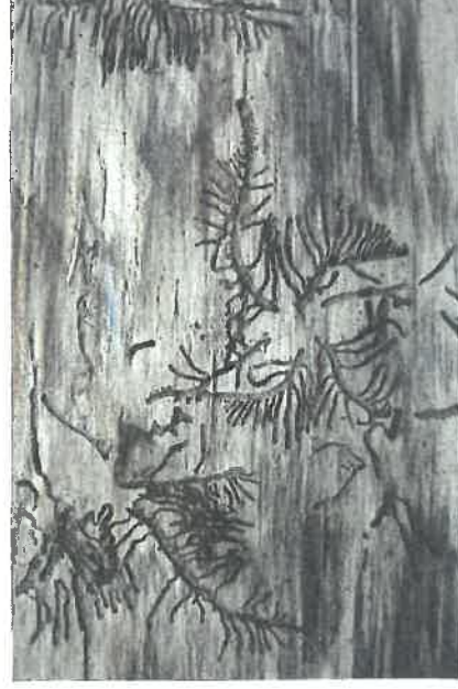
Požerek lýkožrouta lesklého