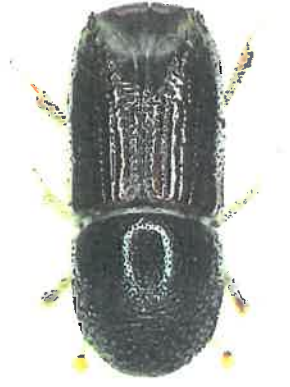
Dospělec lýkožrouta smrkového

Lýkožrout smrkový (cca 5 mm) napadá především čerstvě odumřelé dříví (polomy, vyřezané dříví v porostu nebo na skládkách), dále pak oslabené stojící stromy (např. suchem) a při přemnožení i zdravé stojící stromy. Vývoj probíhá pod kůrou na kmenech