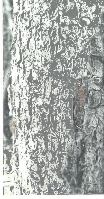
Drtinky na ležícím kmenu