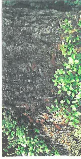
Drtinky na patě stojícího stromu

Na stojících stromech je prvním symptomem přítomnost drtinek na patě kmene. Na kmeni se objevují závry, doprovázené často výrony pryskyřice (pozor: v případě oslabení suchem k tomuto smolení často nedochází). Posléze dochází k barevným změnám jehličí, které postupně rezne a opadá. Dochází také k opadávání kůry, napřed na malých ploškách, později prakticky na celém kmeni. Napadené stromy již nelze zachránit, je nutné je urychleně pokácet a následně asanovat. Na ležících stromech se nacházejí závrtové otvory, vedle kterých se objevují hromádky rezavých drtinek.