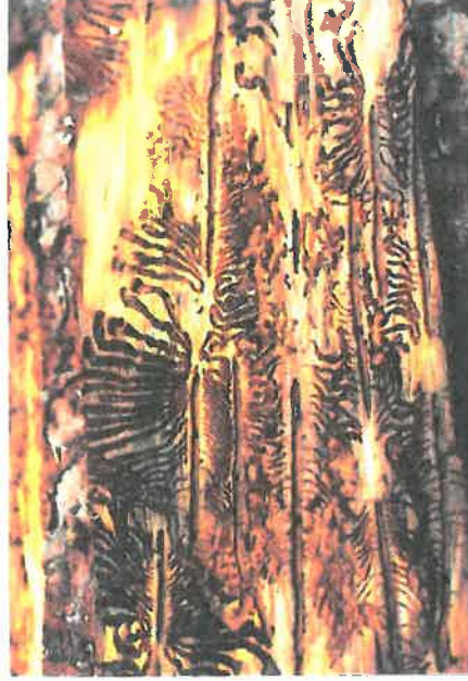
Rozvinutý požerek lýkožrouta smrkového

dospělých smrků s výjimkou jejich vrcholku (nejčastěji od stáří 60 let, výjimečně i mladších). Jeho vývoj trvá obvykle 6 – 10 týdnů, v závislosti na teplotě.