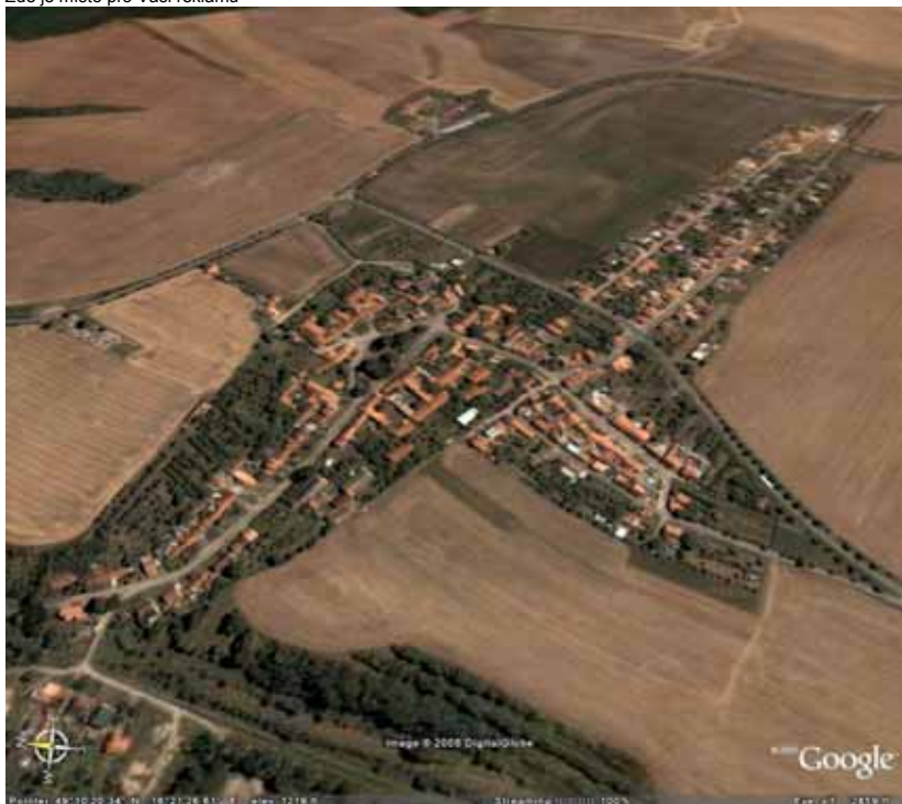
Satelitní pohled na obec Babice z roku 2005

Babický zpravodaj – vydává obec Babice občanům zdarma